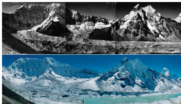
Imja Glacier, central Himalaya.